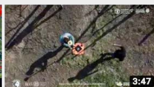
Soilution System - Introduzione al progetto

Iniziativa finanziata dal Programma di Sviluppo Rurale per il Veneto 2014 - 2020.