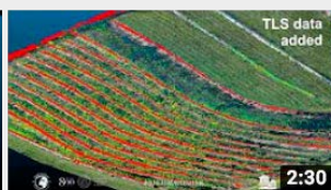
Terrestrial Aerial SfM and TLS data fusion for...