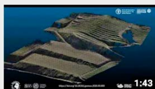
Soilution System - Monte Carbonare, Soave (Verona ...